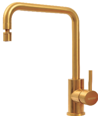
Gold Ref.: 94520/312