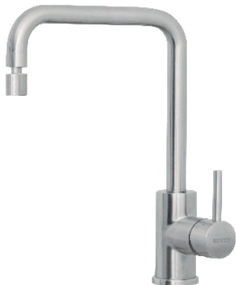
Aço Inox Ref.: 94520/022