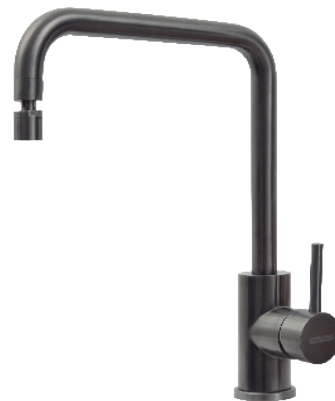
Black Ref.: 94520/512

Revestimento PVD (Physical Vapor Deposition): é um processo para produzir um vapor metálico que é depositado sobre a peça como se fosse uma fina camada colorida.