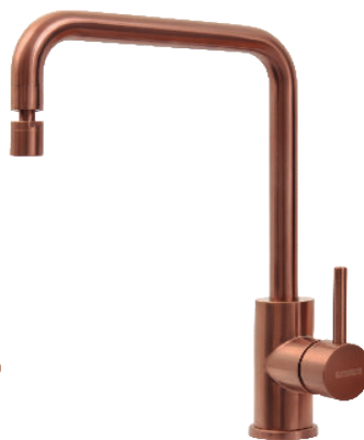
Rose Gold Ref.: 94520/412