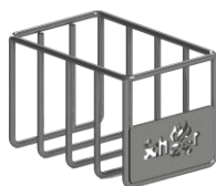
Mexedor de brasas